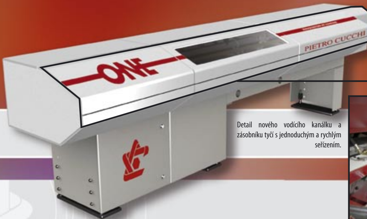
Detail nového vodícího kanálku a zásobníku tyčí s jednoduchým a rychlým seřízením.